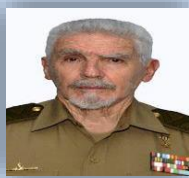
Cmdte. Rev. Ramiro Valdés Menéndez