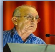
Ulices Rosales del Toro