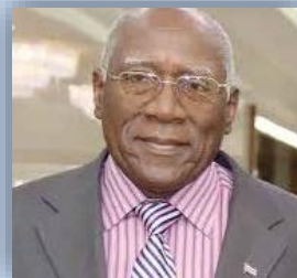
Salvador Valdés Mesa Primer Vice Presidente