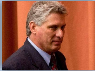
Miguel Díaz Canel-Bermúdez Presidente